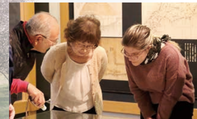
ガイドスタッフが、丁寧にご案内、ご説明いたします。