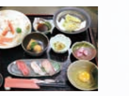
□オーナー自ら料理する 夕食の一例