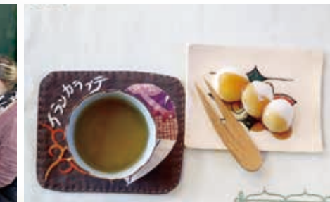
□アイヌ語で「シト」と呼ばれる団子とエント茶