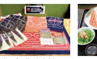
□白老の手工芸のお土産も