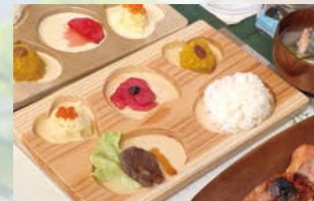
□田村家に伝わるアイヌ料理

お腹が空いたら、オーナーの田村家に伝わるアイヌ料理をみなさんにもご提供。日本の伝統食を作るのに欠かせない「麴」などを使い、とても食べやすく美味しいお料理に工夫されています。デザートのお団子とお茶は、旅の疲れも忘れてしまいます。