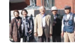
□陣屋資料館友の会のみなさん