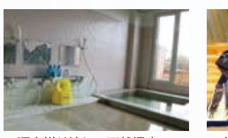
□源泉掛け流しの天然温泉