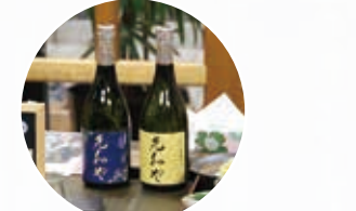
□オリジナルラベルの焼酎(麦・芋)