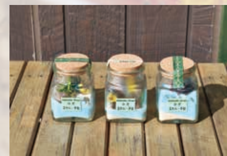
□完成した作品は、旅の思い出にお持ち帰りいただけます