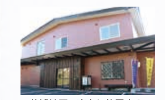
□竹浦地区の高台に位置する 民宿元和や