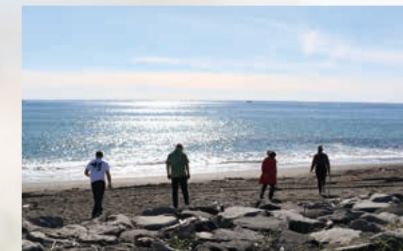
□散歩だけでも気持ちよい海岸は、波の音も心地いです

白老の海岸にある貝殻や、流木などを実際に拾い集めて見ませんか？そして、それぞれのインスピレーションで、小さなアート作品を作ります。簡単なので、誰でもすぐに作ることができます。